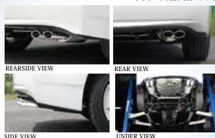
REAR SIDE VIEW